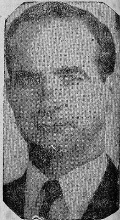
Doñ José Figueres F.