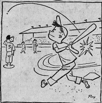
i Muchacho, qué fuerza le da